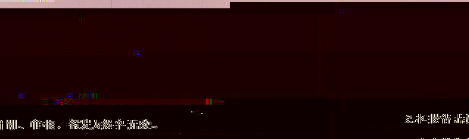
Figure 1: Aerial view of the industrial site. The image shows a large, complex of buildings and structures, likely a refinery or chemical plant, with a central tower. The surrounding area is mostly flat and appears to be an industrial zone.